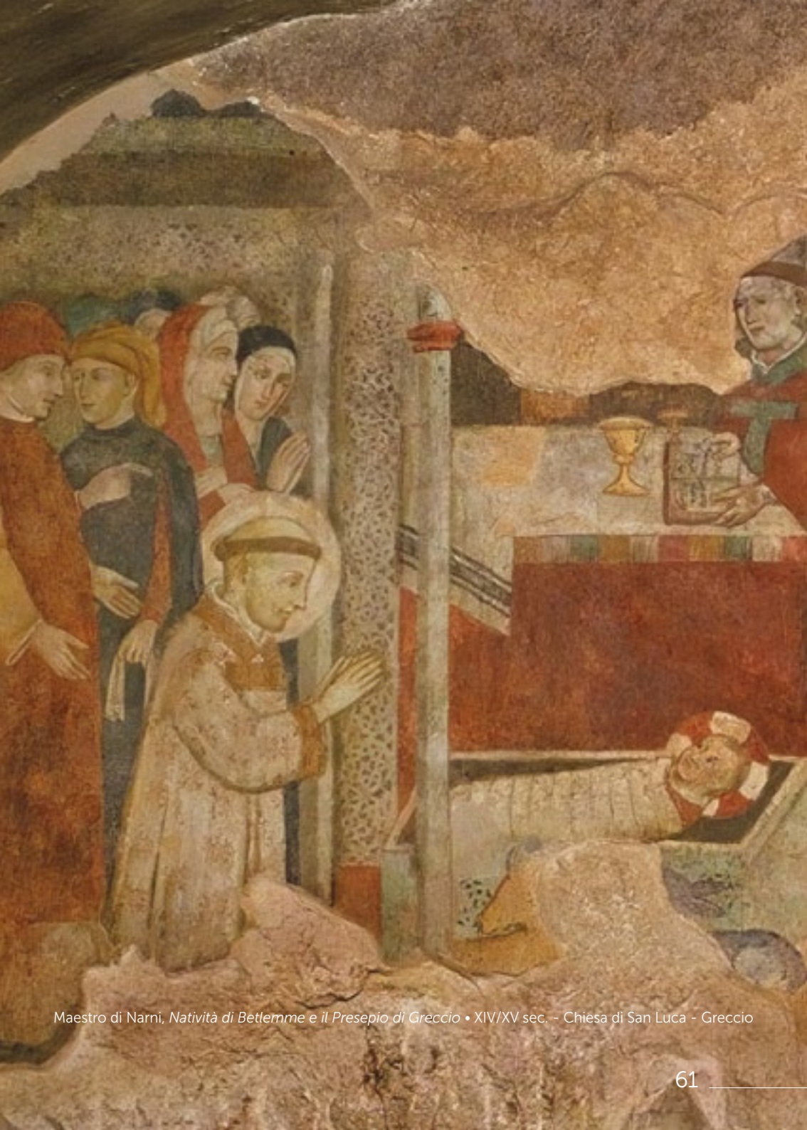
Maestro di Narni, Natività di Betlemme e il Presepio di Greccio • XIV/XV sec. - Chiesa di San Luca - Greccio